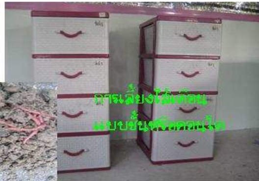
การเลี้ยงไส้เดือนแบบชั้นเพื่อความสะดวก