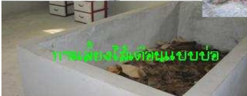
การเลี้ยงไส้เดือนแบบบ่อ